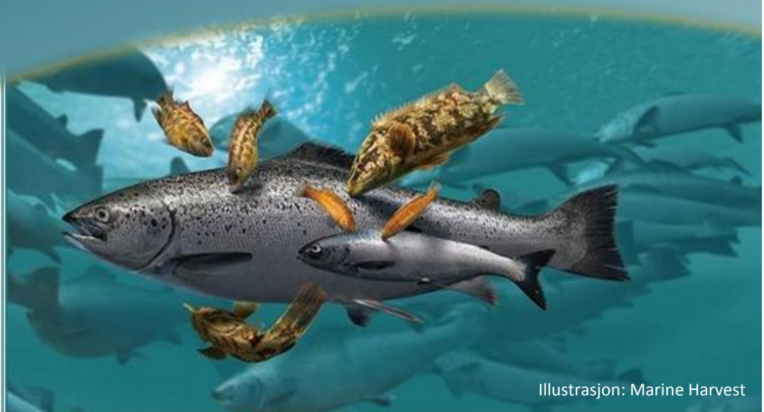
Illustrasjon: Marine Harvest